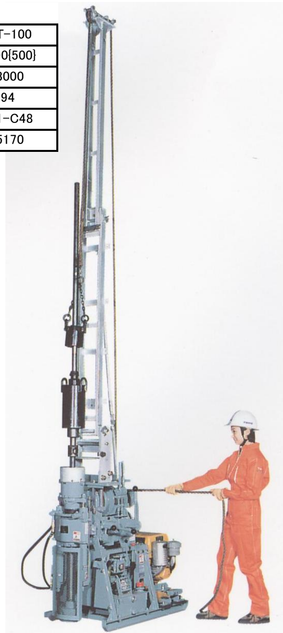
Drilling machine model D0-D